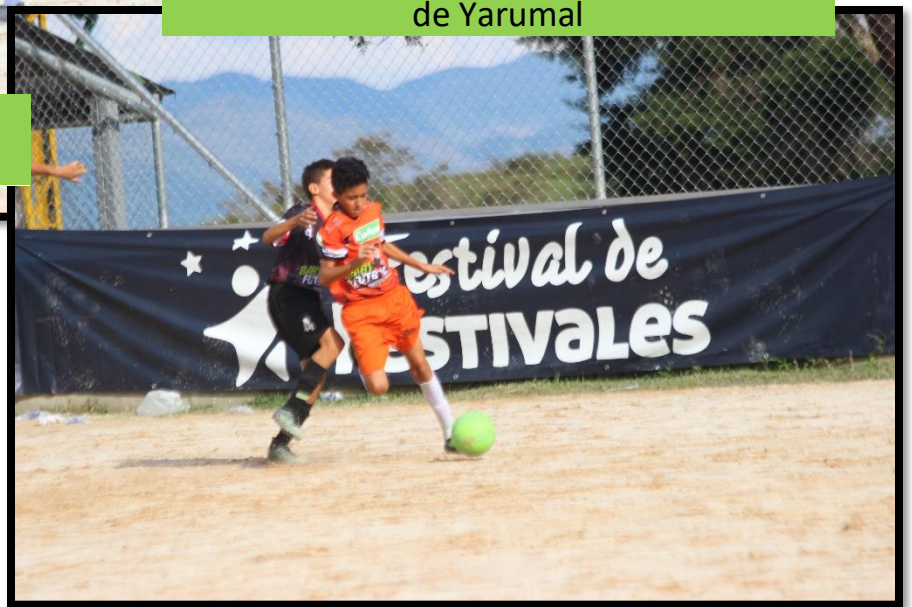
Municipio de Taraza (naranja) vs C. Ochali de Yarumal