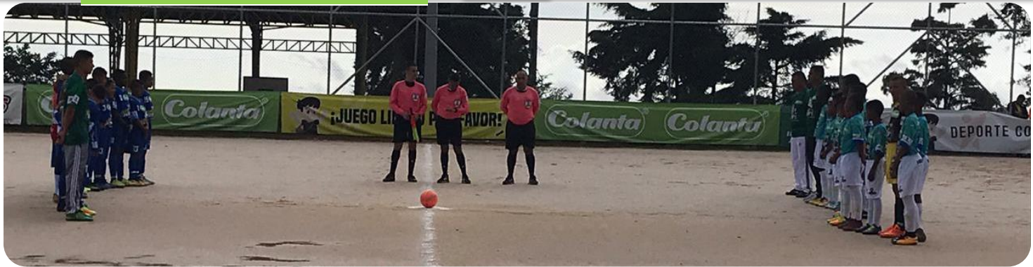
Municipio de Yarumal (gris) vs C. Bellavista de Donmatías