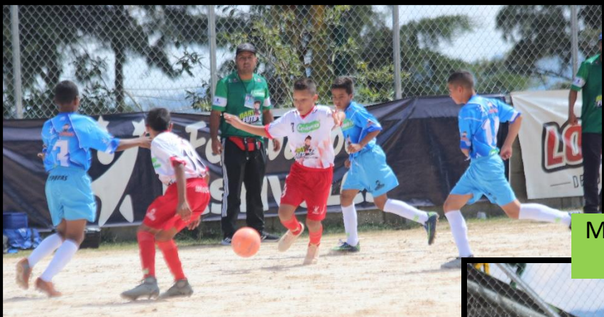
Municipio de San Pedro de Los Milagros (azul) vs C. Palomar de Caucasia