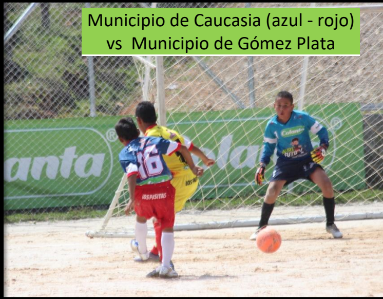
Municipio de Caucasia (azul - rojo) vs Municipio de Gómez Plata