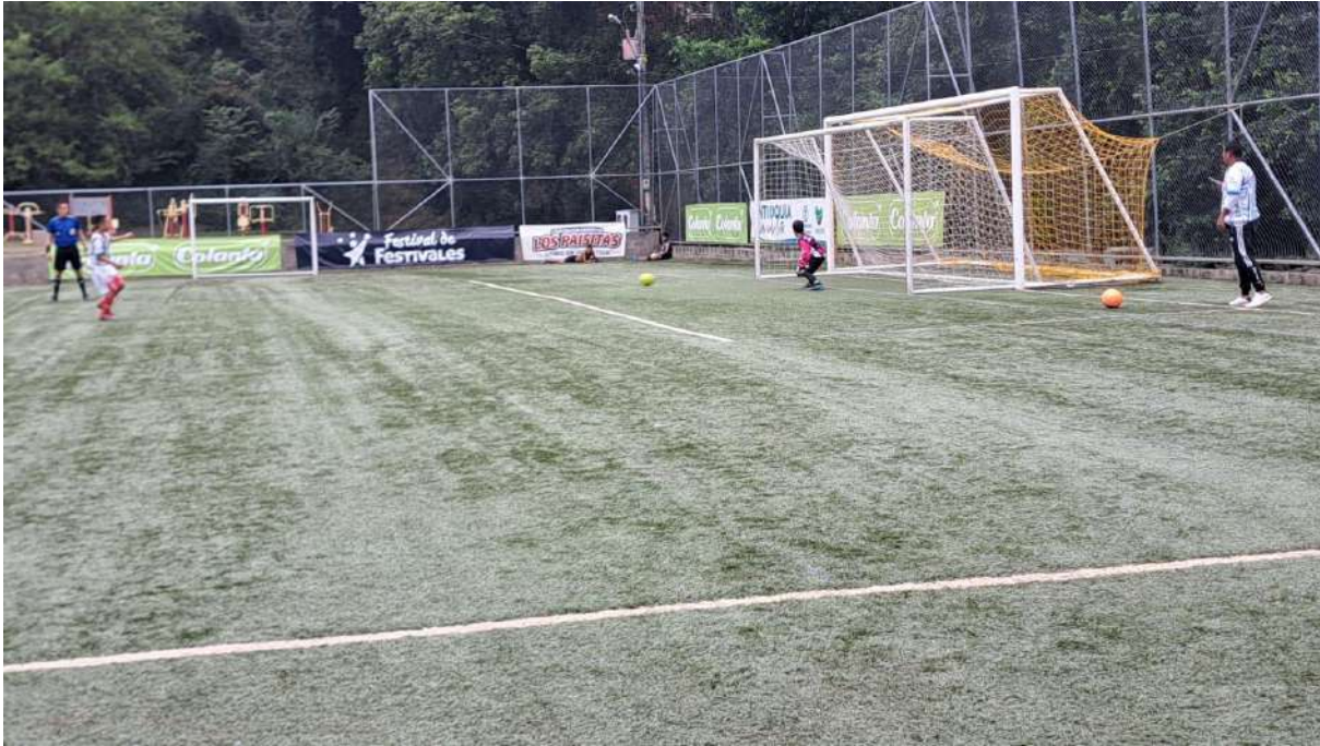
TABLA DE GOLEADORES BABY FÚTBOL MASCULINO "COLANTA"